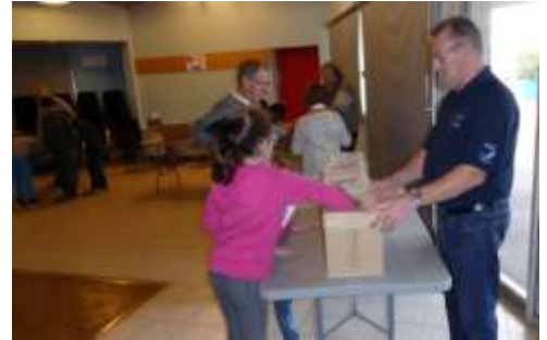
Le festival accueille les écoles : visite des exposition de photos, projection d'un reportage et atelier de biologie sous -marine.