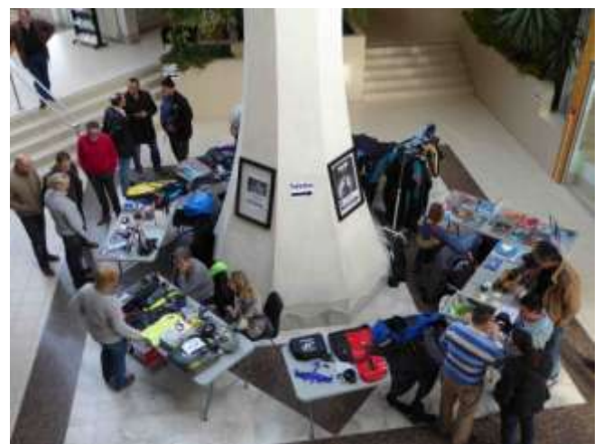
Quelques stands ont investi le hall de l'Espace Béraire pour la première édition des Puces d'eau. rendez-vous est donné pour l'an prochain...