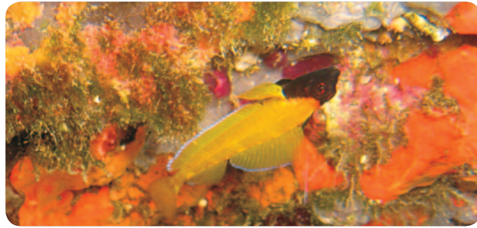
Les phares à Led permettent la prise de vue rapprochée d'espèces pas trop mobiles...

proposée par le boîtier (généralement f8), il est nécessaire de pousser la sensibilité et de descendre en vitesse.