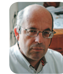
peu un flash destiné aux APN compacts. Par Yves Kapfer.

Fantasea est connue pour ses caissons en polycarbonate avec une réputation mitigée. La marque israélienne, après avoir abandonné les caissons pour reflex, commercialise depuis