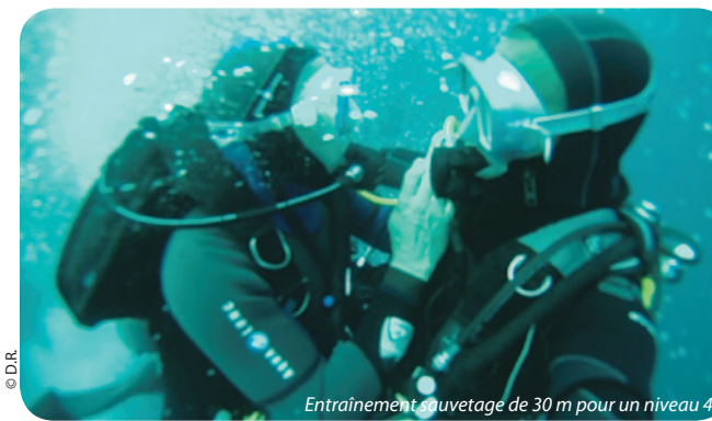
Entraînement auvetage de 30 m pour un niveau 4.

plongée qui me l'a apportée ! Il m'a fait découvrir un matériel vidéo novateur et performant que j'ai trouvé sensationnel pour l'enseignement de notre activité. Enfin un matériel adapté à notre pratique subaquatique ! Je tiens par cet article à vous le présenter. Cette caméra est aussi très utilisée pour des images de surf.