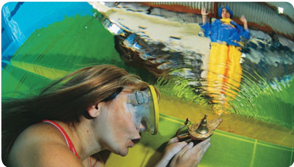
© Robert Pakiela champion de France 2009

Il aura lieu à Suresnes le 22 mai 2010. La commission nationale audiovisuelle a mandaté la commission régionale audiovisuelle Ile de France-Picardie de la FFESSM, le CODEP 92 et le club de plongée de Suresnes pour organiser à Suresnes (92) le 23 e championnat de France de photographie subaquatique en piscine.