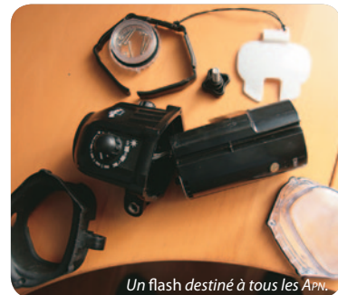
Un flash destiné à tous les APN.