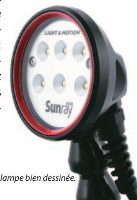
Une tête de lampe bien dessinée.

temps avant de se familiariser avec les différents boutons. L'entretien est simple, deux joints pour la porte arrière et pour les optiques. Fabriqué en Californie, il s'agit d'un matériel haut de gamme et donc le prix s'en ressent évidemment. Si le Stingray G2 est à 2000$, son grand frère le G2 + à 3300 $, le Bluefin lui est à 4300 $. À cela il vous faudra rajouter de 500 à 1800 $ pour une lentille grand-angle ou macro, de 1800 $ pour l'éclairage Sunray 600 à 1800 $ pour le Sunray 2000. Comme vous l'avez constaté les prix sont donnés en dollars et dépendent donc de la parité euro/dollar qui n'est pas à notre avantage pour l'instant. À ce prix votre caméscope de 500 à 1500 € selon les modèles sera bien protégé. Vous disposerez toutefois d'un petit bijou vous permettant de faire de superbes images en haute définition au nouveau format AVCHD; avantage non négligeable vous pourrez le conserver si vous changez de caméscope! ■