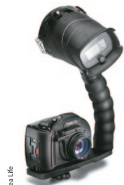
Un ensemble cohérent et compact.

protection contre les chocs. Sealife innove dans le domaine des appareils photos sous-marins en supprimant les traditionnels boutons situés à l'arrière de l'appareil pour les remplacer par cinq touches "piano" que l'on peut actionner facilement avec le pouce. Le large bouton d'obturateur a été doté d'un sélecteur maniable du bout des doigts qui permet de faire défiler les menus ou d'effectuer un zoom avant/arrière sans relâcher la prise de l'appareil. ■