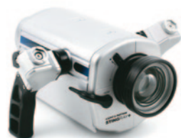
Un caisson plutôt compact.

La gamme Stingray G2 et G2 + dispose d'un écran LCD de 2,7 pouces, à luminosité et contraste réglables, d'une poignée de commande avec contrôle de la balance des blancs et en option d'une deuxième poignée de commande du menu permettant d'accéder à tous les contrôles du caméscope. Le G2 est équipé d'un hublot plan, tandis que le G2 + accepte des optiques grands-angles. Ils peuvent être équipés manuellement d'un filtre correcteur de couleurs et d'un dioptré macro.