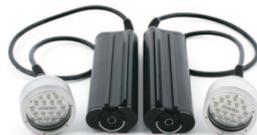
Les blocs accus autorisent une bonne autonomie.

et d'extinction est assurée à partir d'un bouton de commande sur la poignée de gauche. Les accus NiMH de 7,2 volts sont logés sous le caisson et il est possible de disposer d'un jeu de recharge pour disposer de plus d'autonomie de l'éclairage. Caisson, lampes, bras et accus représentent donc un ensemble assez compact, aisément transportable dans une valise de type cabine. Sous l'eau le caisson est légèrement négatif, ce qui assure une bonne stabilité même lors du palmage. L'écran est peut-être un peu bas ce qui oblige à tenir l'ensemble en hauteur et devient gênant lors de prise de vues sur le fond. Il n'est pas prévu de branchement pour un écran extérieur. Les commandes sont faciles à manipuler, il faut toutefois un certain