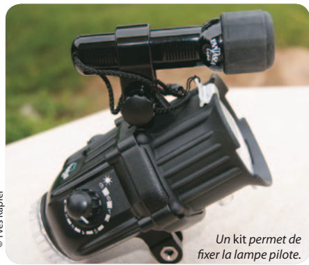
Un kit permet de fixer la lampe pilote.

être manipulé sans forcer. Le flash y est fixé à l'aide d'une attache du type Ys.