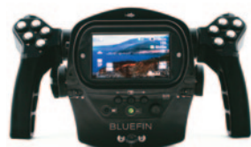
Un bon contrôle des prises de vues.

La gamme Bluefin, haut de gamme de la marque, est équipée d'un écran OLED de 3,2 pouces. Ce type d'écran de nouvelle génération est encore plus lumineux que les écrans LCD, permet un contrôle des prises de vues même par forte luminosité. Il comprend de base une poignée à droite avec les commandes principales, power, stand by/record, zoom avt./arr. , et à gauche une poignée d'accès au menu, avec commande de prises de photos. Le caisson dispose également d'une molette rapide de réglages de vitesse d'obturateur, de diaphragme et de mise au point. Le Bluefin est enfin équipé d'un micro, dont l'utilité sous l'eau est discutable, mais qui permet des prises de vues avec enregistrement du son sur un bateau sans être obligé de sortir le caméscope de son caisson et ainsi l'exposer aux embruns ou aux projections d'eau de mer dont on sait qu'elles sont fatales pour le caméscope. Le filtre correctif de couleur est interne et le caisson accepte bien sûr les différentes optiques Fathom qui sont proposées en option ( fish-eye, grand angle ).