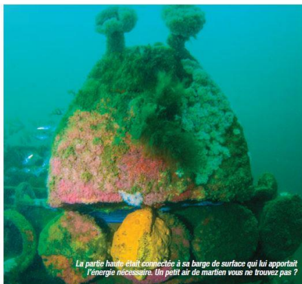
La partie haute était connectée à sa barge de surface qui lui apportait l'énergie nécessaire. Un petit air de martien vous ne trouvez pas ?

emportés et des interventions de secours seront nécessaires pour récupérer le matériel dérivant. À ces incidents de chantier (rupture de canalisations et perte des matériaux immergés donc, mais aussi mouillage de la barge qui cède, etc.), et aux péripéties administrativo-politiques (retard des paiements), succèdent des drames avec une noyade puis deux accidents de plongée dont un mortel. Confrontée à une telle succession de problèmes et tragédies, la compagnie Harmstoff, pourtant solide et expérimentée dans les travaux de haute mer, doit se résoudre à déposer le bilan. Le matériel de surface est alors saisi et le Chariot est tout simplement – nouvelle tempête oblige – abandonné au fond en 1972, avant de tomber dans l'oubli. Pour clore cette épopée, précisons qu'il faudra attendre deux nouvelles années pour qu'un ouvrage conventionnel soit construit, à savoir une jetée métallique amenant le collecteur loin en mer, le « Wharf »