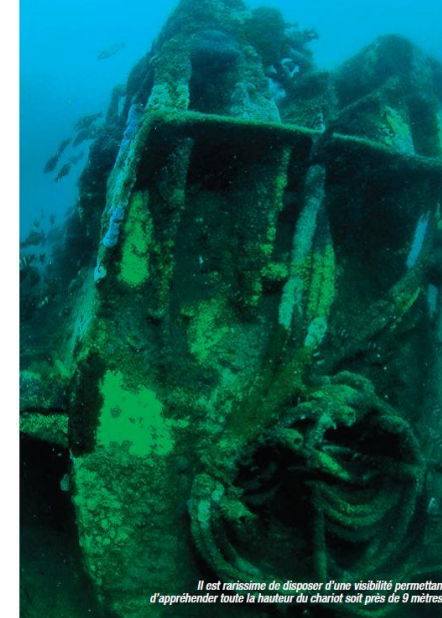
Il est rarissime de disposer d'une visibilité permettant d'appréhender toute la hauteur du chariot soit près de 9 mètres.