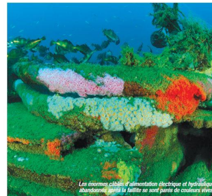
Les énormes câbles d'alimentation électrique et hydraulique abandonnés après la faille se sont parés de couleurs vives.