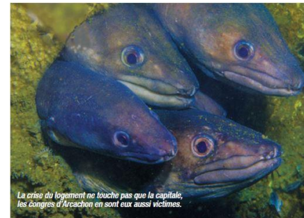
La crise du logement ne touche pas que la capitale, les congres d'Arcachon en sont aussi victimes.

Le Chariot par ses dimensions n'a rien à envier à une épave de navire de type remorqueur ou chalutier. En effet, il est long de 29 mètres pour 12 de large et haut de 9 mètres pour un poids de 140 tonnes. L'exploration débutera au plus bas (- 30 mètres à l'étable de pleine mer) en prenant comme repère les quatre chenilles et les caissons ballasts. À noter qu'au-dessus de ces derniers se situe la partie hydraulique et électrique du Chariot . Reposant sur un fond de grave, les caissons peuvent être totalement envasés ou totalement libres selon la saison.